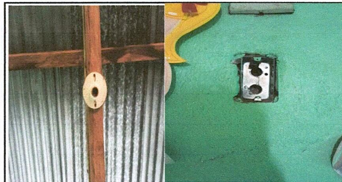
Instalación de corriente eléctrica en mal estado.