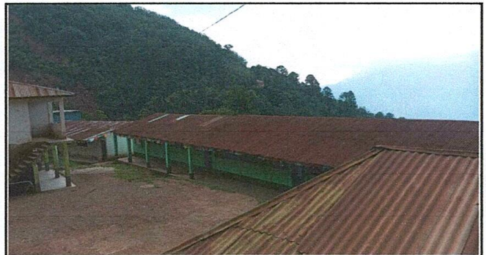
Lámina en mal estado.

Observación: Si es necesario se pueden agregar hojas adicionales y actualizar el número de hojas.