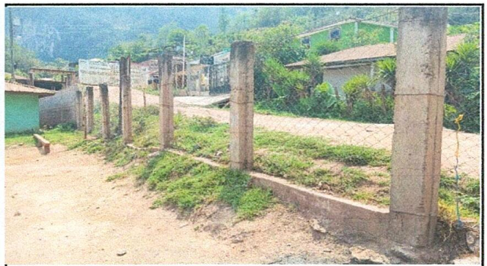
Muro perimetral incompleto.